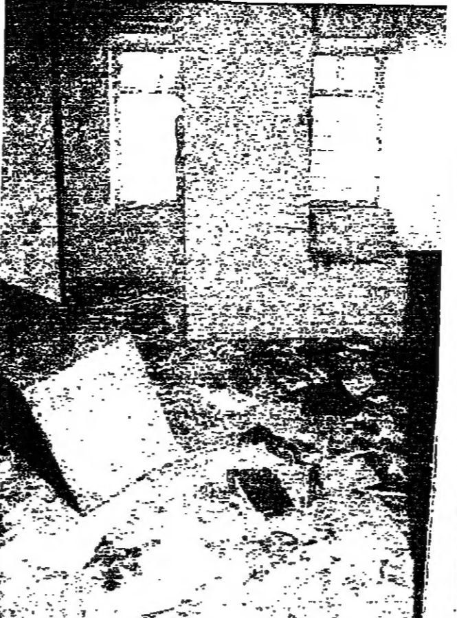
مكتب الجريدة كما هو اليوم